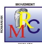
Certificat Nr.015HS OHSAS 18001